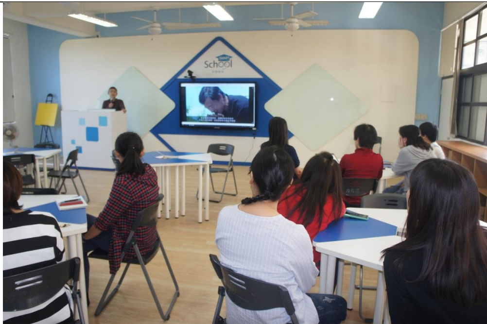
文字說明：觀賞環境教育影片