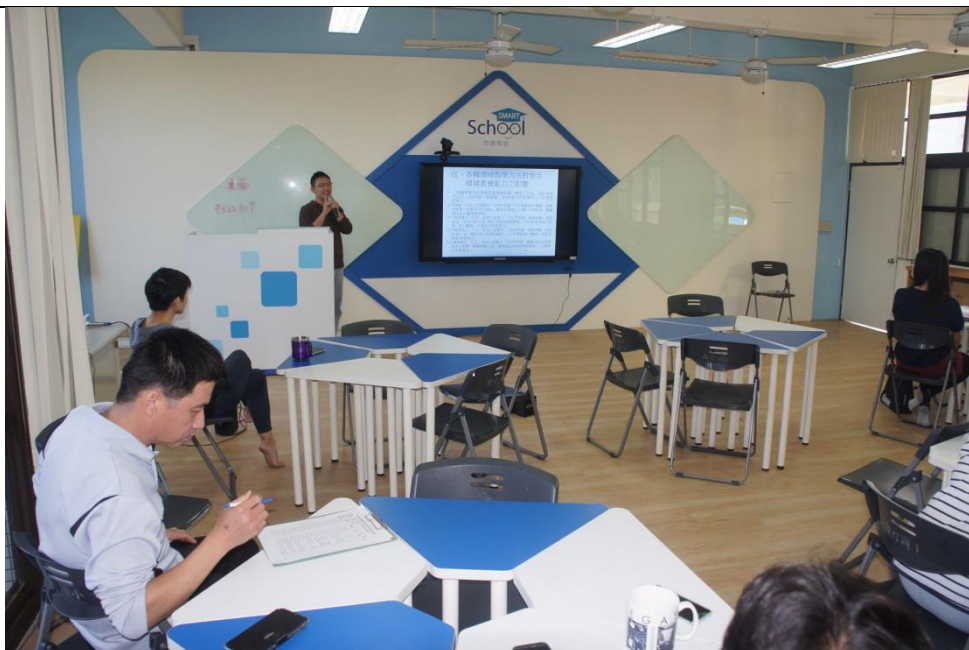
文字說明：學員閱讀研習講義