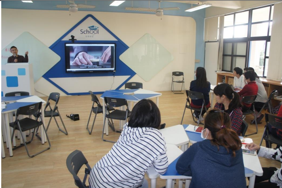
文字說明：學校教職員工專注聽講