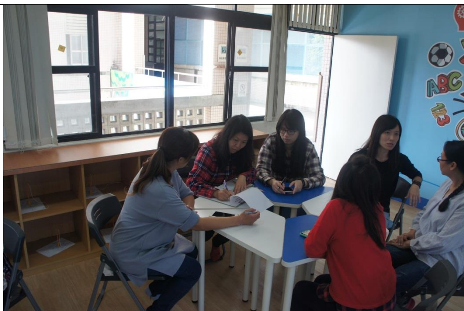
文字說明：分組討論相關議題情形