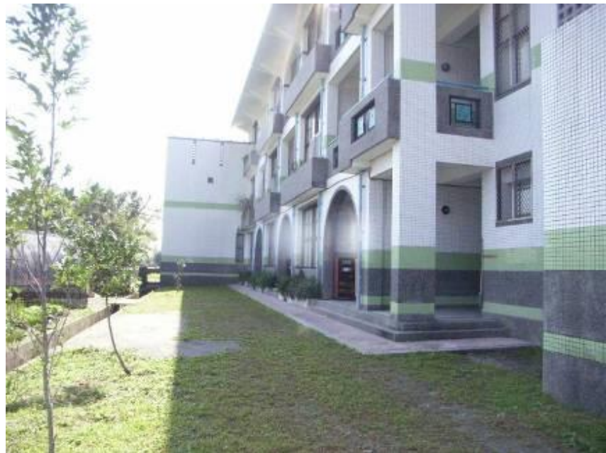
社區多功能學習中心---背面