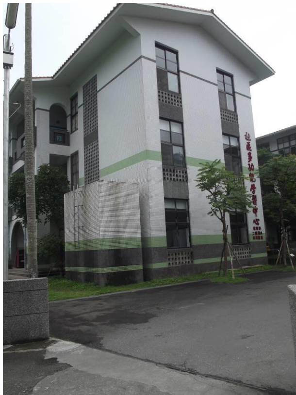
社區多功能學習中心---北側門出入口