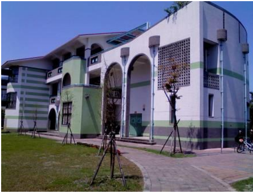
社區多功能學習中心---東側門入口