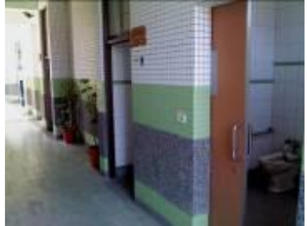
男廁、女廁及殘障廁所各乙間