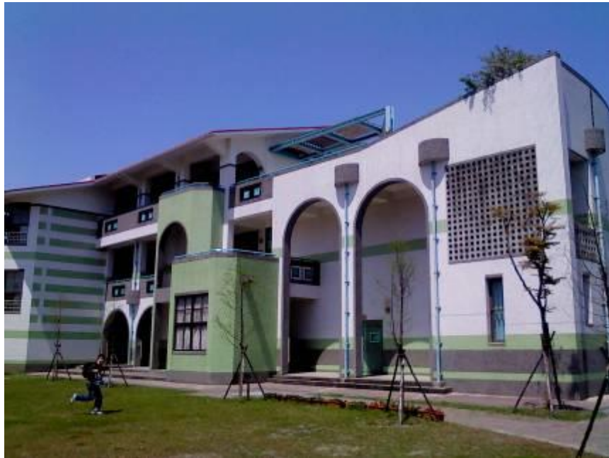
社區多功能學習中心---正面