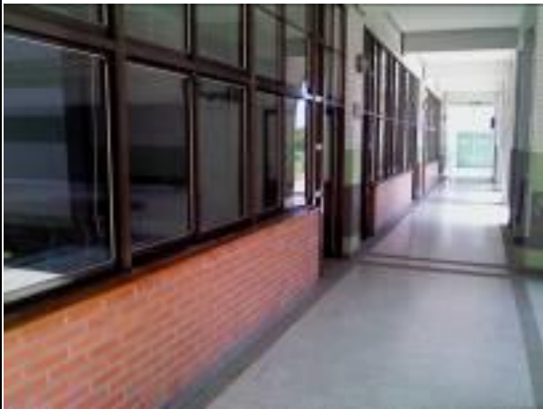
三間普通教室及一間視聽館