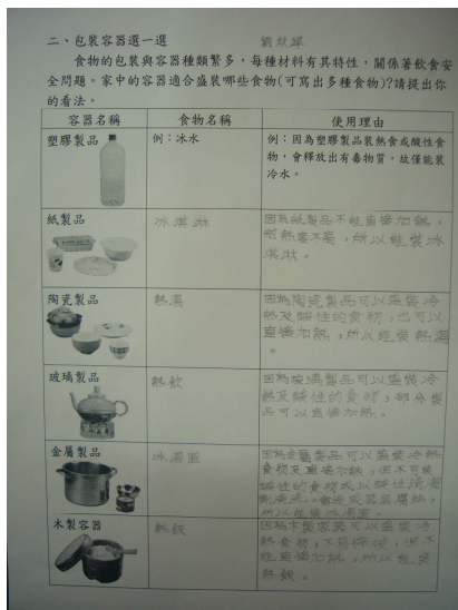
能選擇正確的容器盛裝食物。