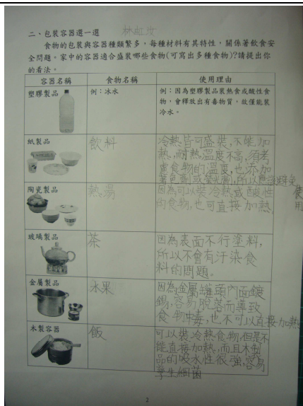
能舉例說明食物包裝與貯存容器的適當性。