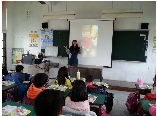
討論女生可以做的，男生是否也可以。男生可以做的，女生是否也可以。