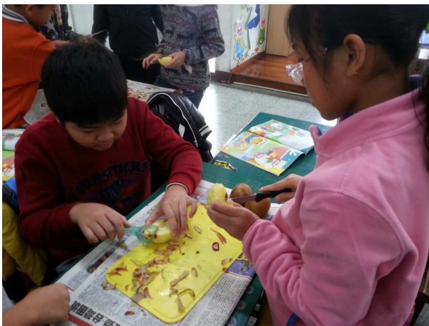
做家事、切水果，男生女生都可以。