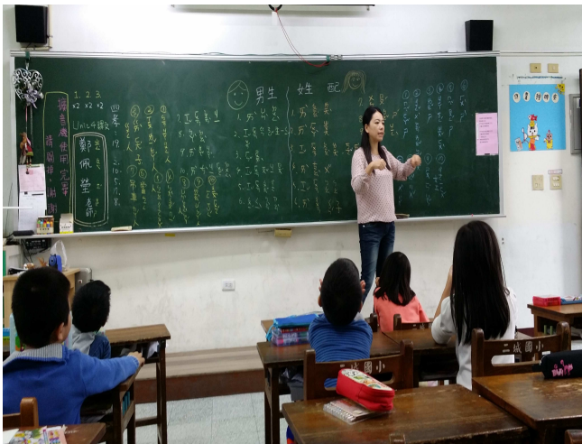
透過討論，發現男女大不同，要互相尊重。