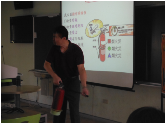
正確使用滅火器講解