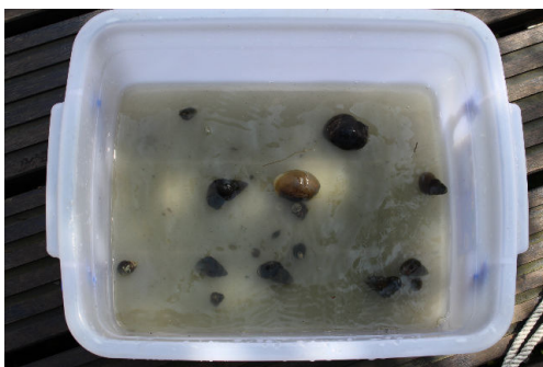
各種不同的螺貝類