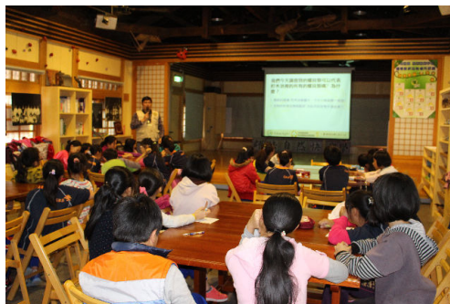
大家再做最後的總結分享