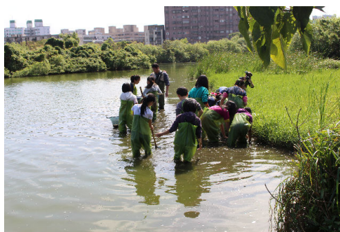
先跟老師絕對萬無一失