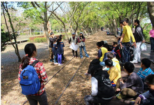
大家可以盡情發表你的想法~~