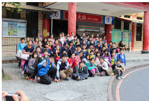
準備賦歸囉！來笑一個，YA