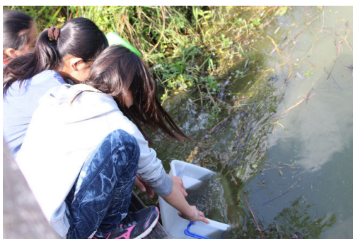
溫柔的把它們放回原地