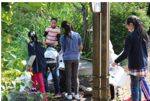
記得清洗乾淨器具！