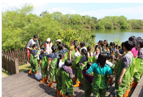
檢查有沒有東西遺落了!