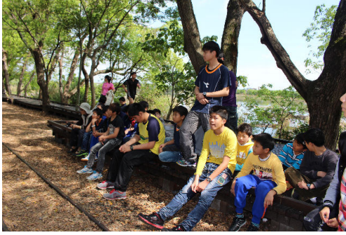
另一組上的是綠色小精靈