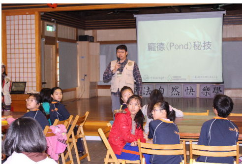
我們這組上的是龐德工作室