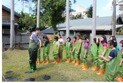
上岸後要清洗裝備！