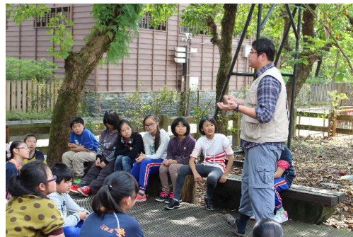
想想在池塘中你觀察到什麼？