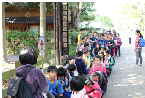
準備好收獲滿滿的行囊