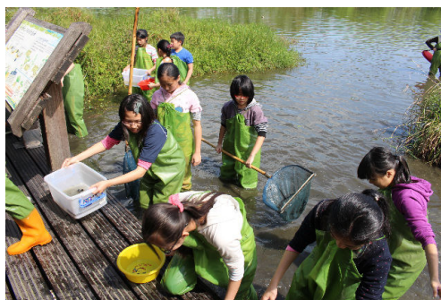
上岸了!時間真快呀!~