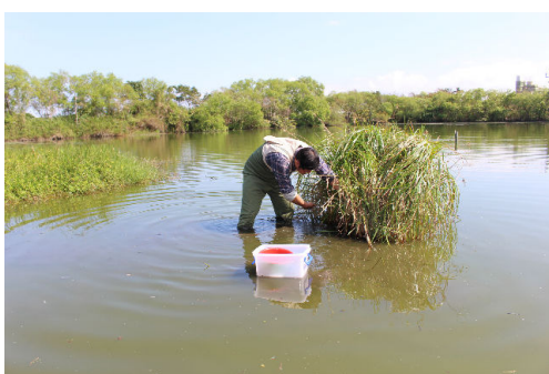
要仔細在水中浮草旁尋找