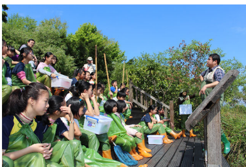
準備下池塘作一名小小偵探員