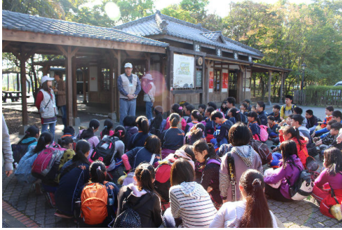
首先來到竹林車站