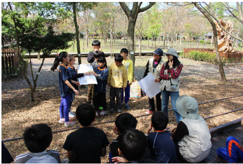
介紹我們如何量樹高？