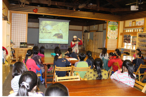
首先要知道龐德要出何種任務？