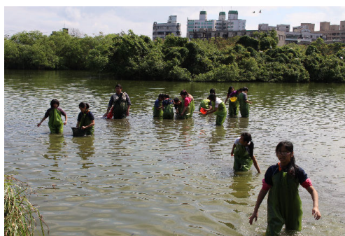
看我們眼明手快，一切躲不過我們的搜尋