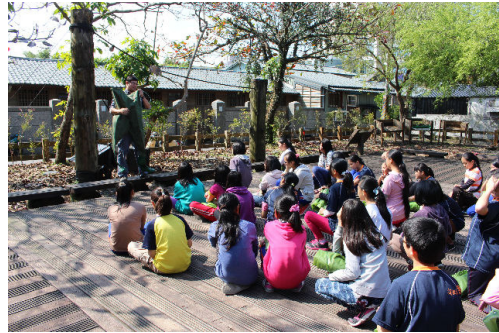
得先了解如何善用手邊的器具