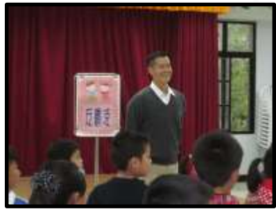
校長進行校園反毒、反霸凌宣導