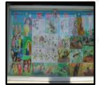
104年1月 六年級萬富報報

3月份的萬富報報是由一年級小朋友來布置，主題是快樂的記憶，小朋友將印象最深刻和家人出遊的情景，用純真的文字，豐富的色彩，將美好的感覺表現出來，很不錯喔！