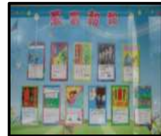
104年3月 一年級萬富報報