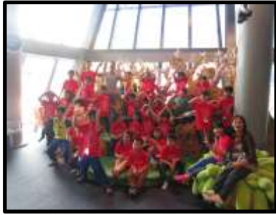
基隆海科館校外教學