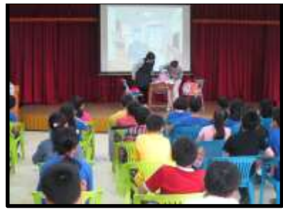
大愛媽媽灑愛活動：環保