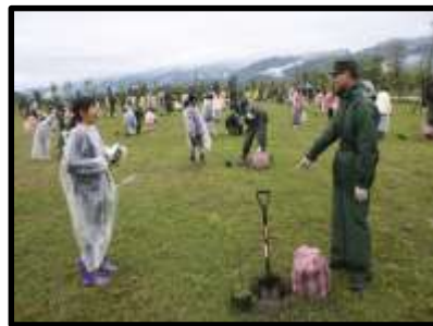
紅柴林軍營植樹活動