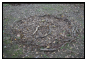
▲佳作:快樂的鳥媽媽