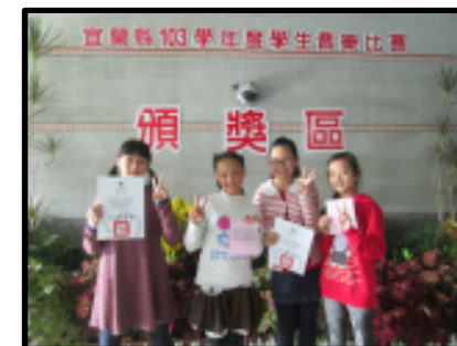
▼宜蘭縣中小學音樂比賽