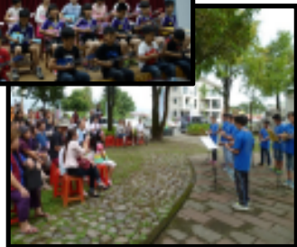
▲三星鄉假日農夫市集演