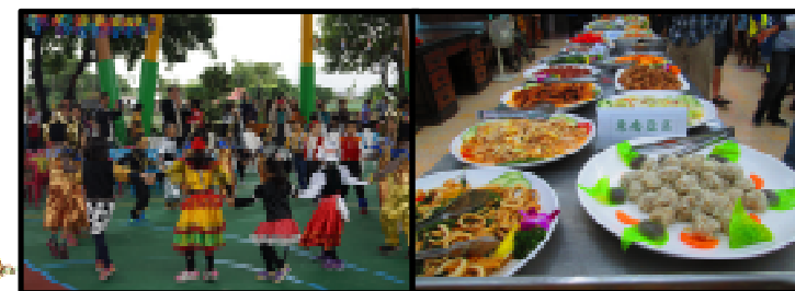
▼校慶運動會結合多元文化展演及異國美食