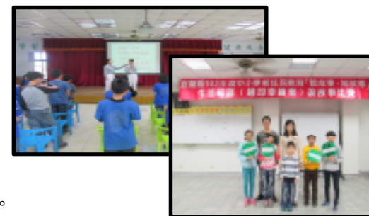
▼新住民說故事比賽