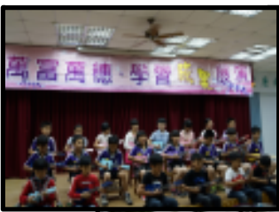
▼成果展中年級表演