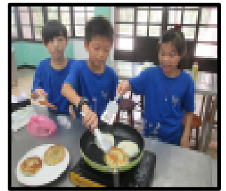
四健會課程學做蔥油餅