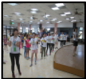
實踐大學應用英語系英語育樂營