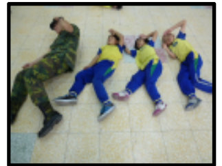
紅柴林營區圍牆裝置藝術活動