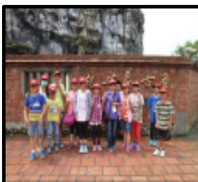
五年級台積電美育之旅