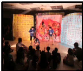
中央大學貝斯兔育樂營