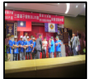
五年級烏克麗麗獲邀演出