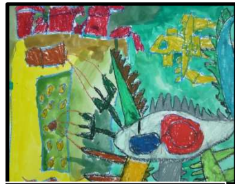
陳奕安/怪獸攻擊城堡