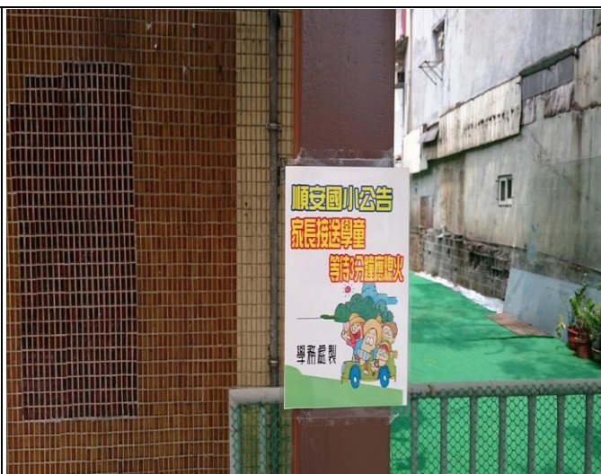
宣導家長接送學童等待 3 分鐘應熄火(東門)