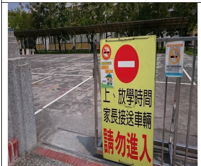
宣導家長接送學童等待 3 分鐘應熄火(西門)