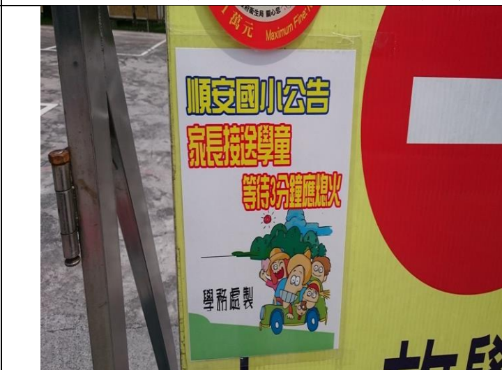
宣導家長接送學童等待 3 分鐘應熄火(西門)