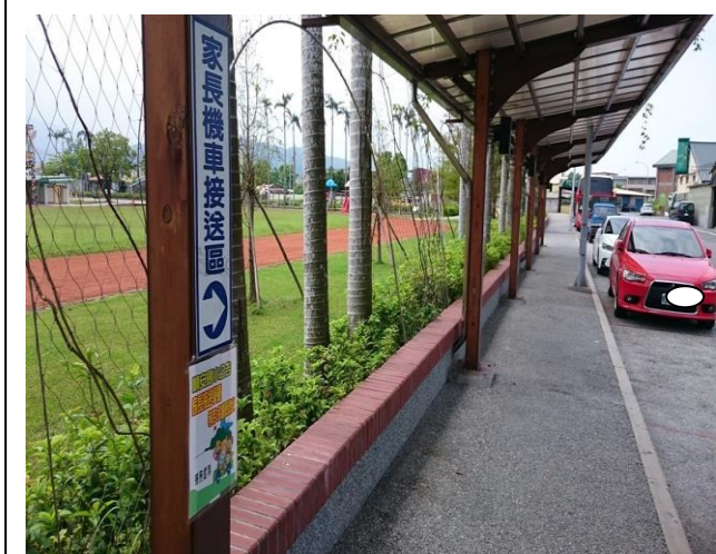
宣導家長接送學童等待 3 分鐘應熄火(正門)