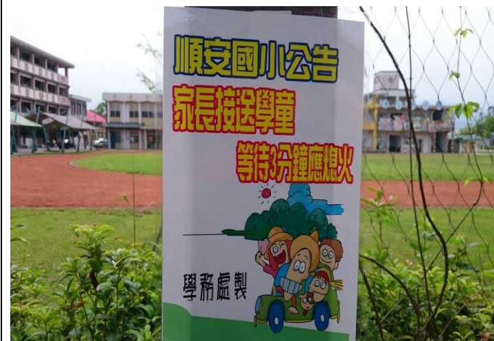
宣導家長接送學童等待 3 分鐘應熄火(正門)