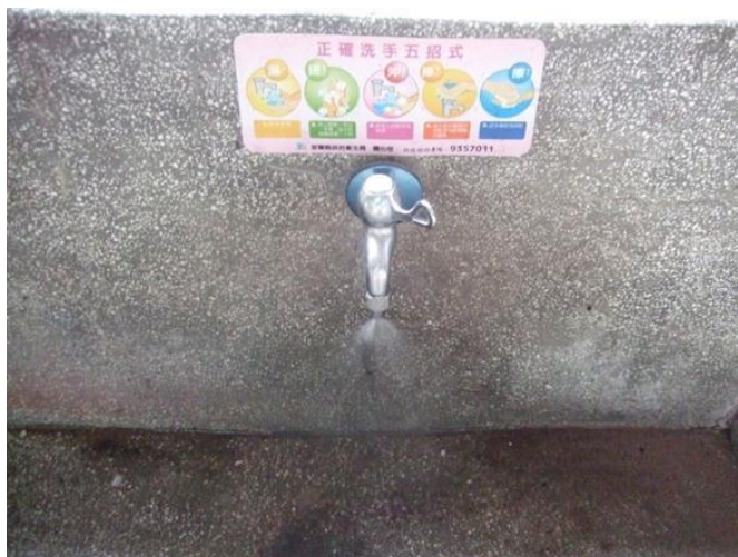
推廣及使用省水水龍頭