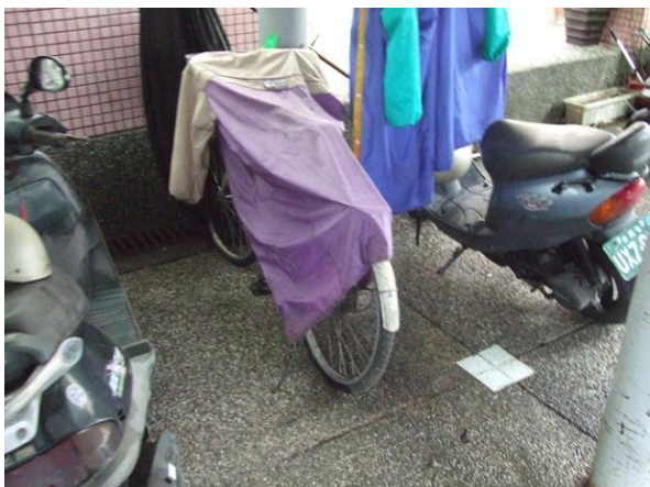
鼓勵同仁騎乘腳踏車上下班