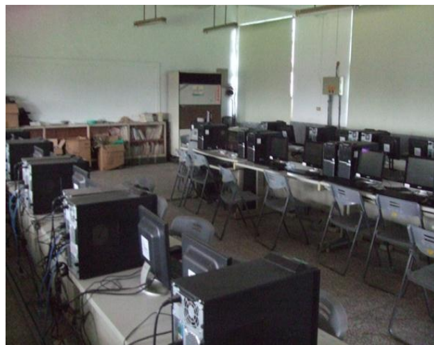
宣導並全面實施電腦教室非使用時間關畢電源