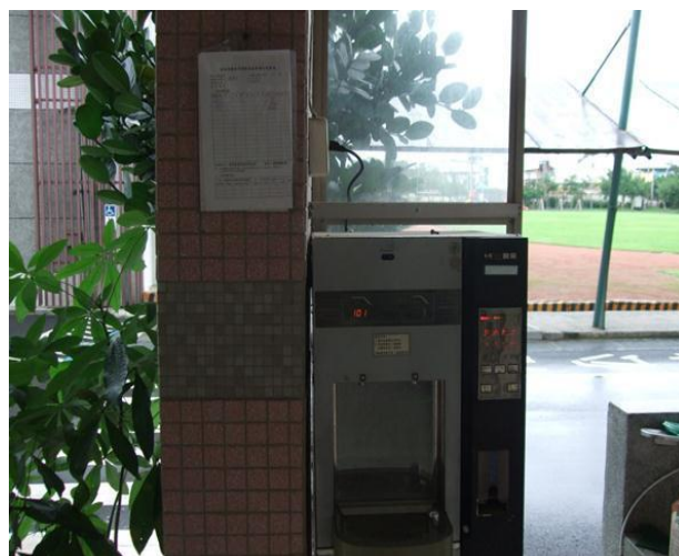
飲水機設定假日節能