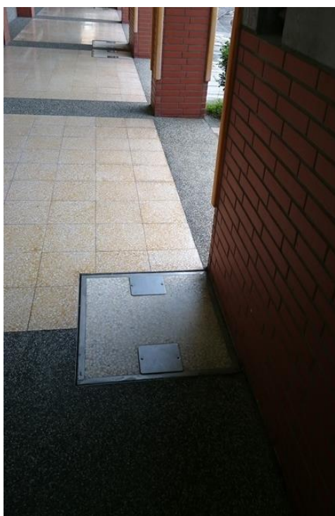
雨水地下儲水槽蓋