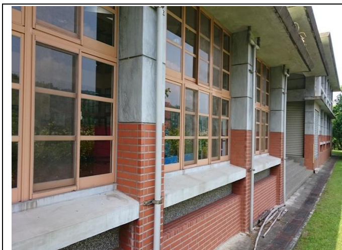
校園地下雨水收集槽