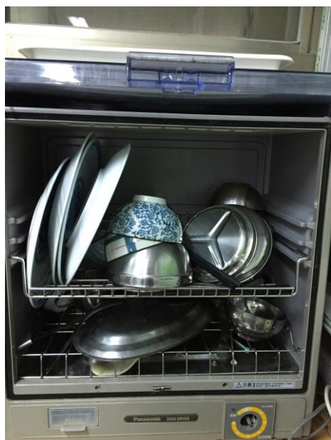
辦公室使用重複使用之茶杯、餐具