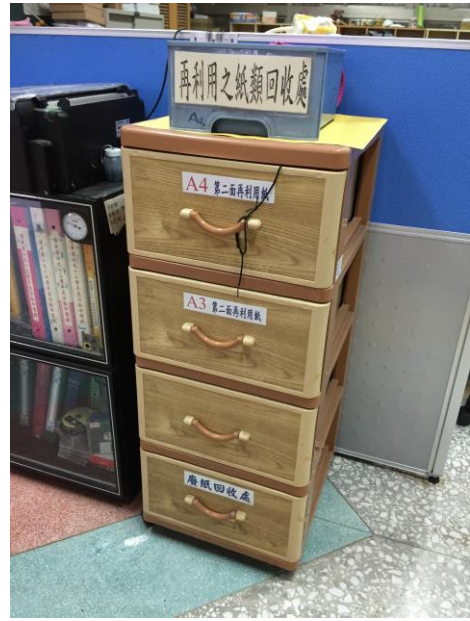
單面影印回收櫃(再利用)