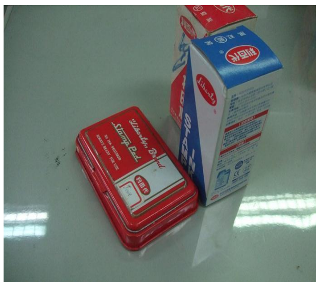
使用可加水之印台