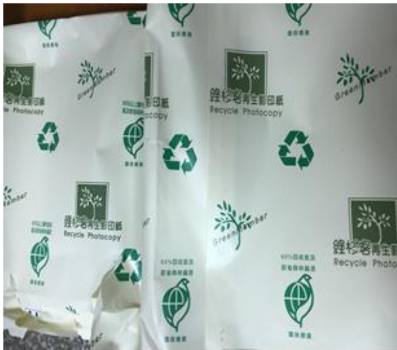
使用環保標章再生紙