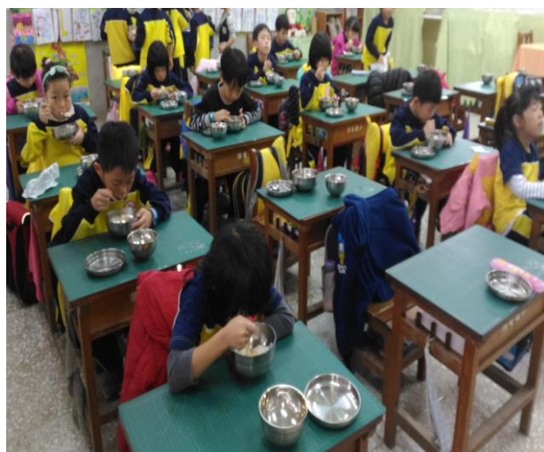
班級全面推行重使用之茶杯、餐具