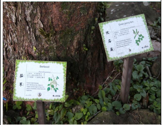
校園植物標示解說牌