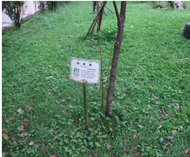
校園植物標示解說牌