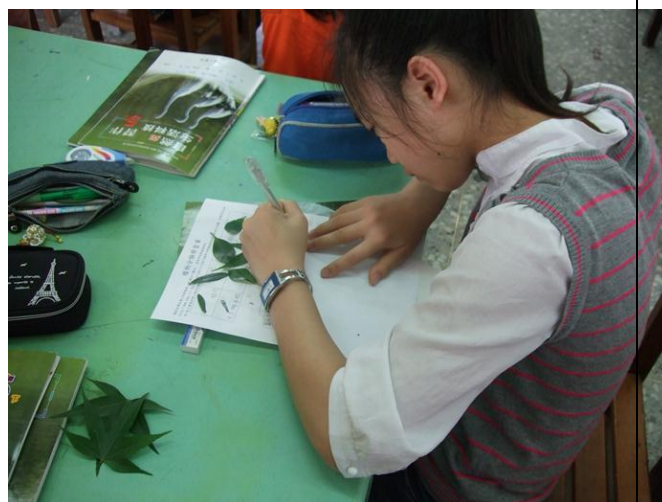
學生認識校園植物