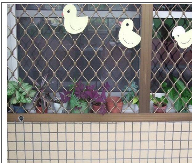
班級種植植物(綠美化)