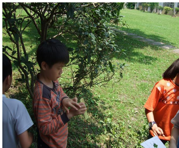
學生認識校園植物