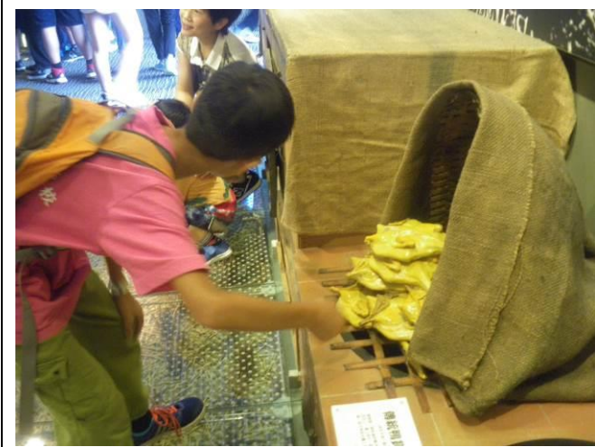
《在地生活》 親炙宜蘭在地名產-鴨賞的製作方式