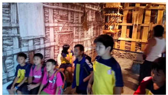
《聆賞專題簡報》 學生能利用館內設備 學習主題館內容。