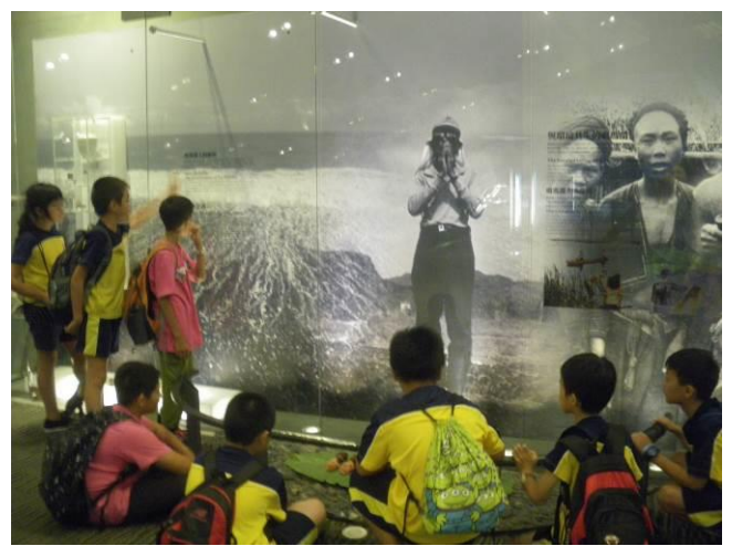
《傳統文化》 了解在蘭陽平原生活的原住民他們的祭祖儀式