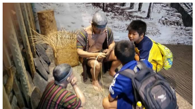
《實地考察》 運用『蘭博蒐查線學習組』實地觀察蘭陽平原 早期先民的生活型態。