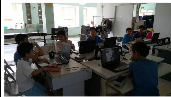
《我是搜查高手細語叮嚀》 老師行前引導學生透過網路 查詢蘭陽博物館相關資料。