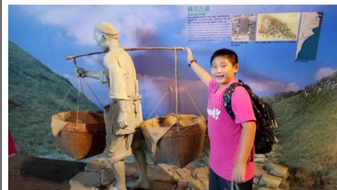
《實地考察》 運用『蘭博蒐查線學習組』實地觀察蘭陽平原 早期先民的生活型態。