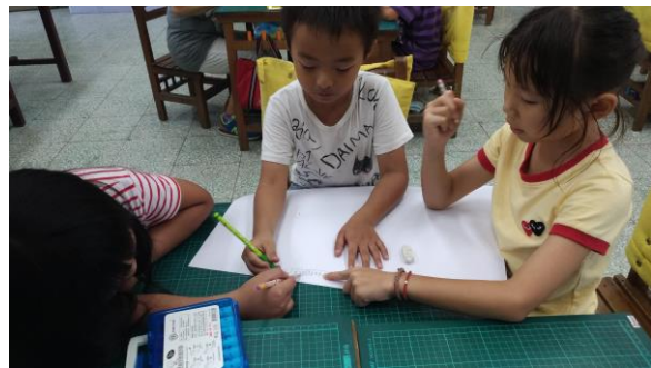
分組討論，共同創作故事結局