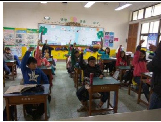
教師引導及透過大家熱烈分享，讓孩子了解邁向節能減碳生活的重要性。