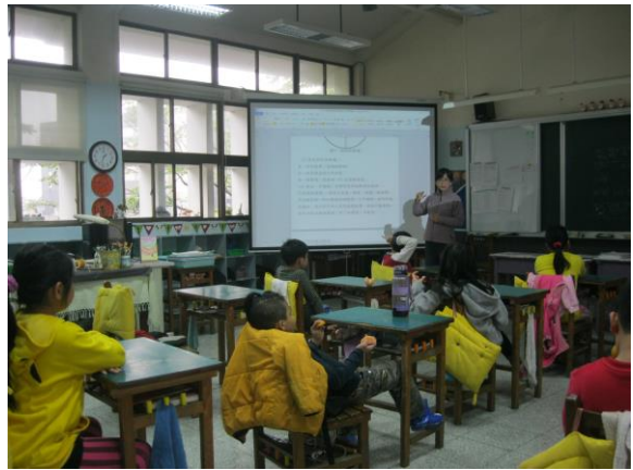
透過討論、講解、影片欣賞，讓孩子了解節能減碳對人類及地球的意義。