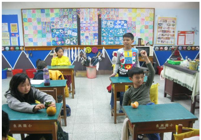
透過遊戲及討論讓學生更了解節能減碳的意義。