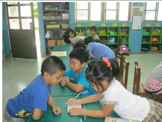
同學認真討論問題