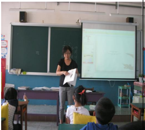
老師提問問題及講解