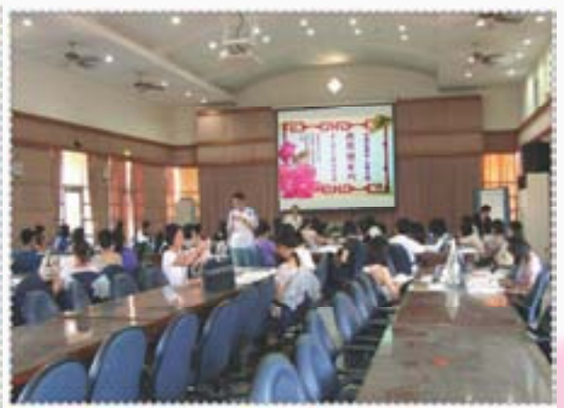
漂亮的海報！順便也拍一張吧！