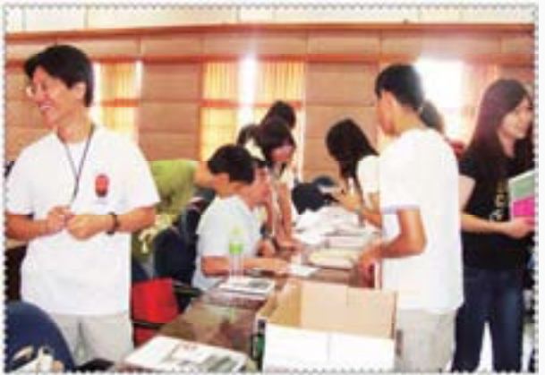
好書大放送，有參加就有一本簡媜的作品，好耶！