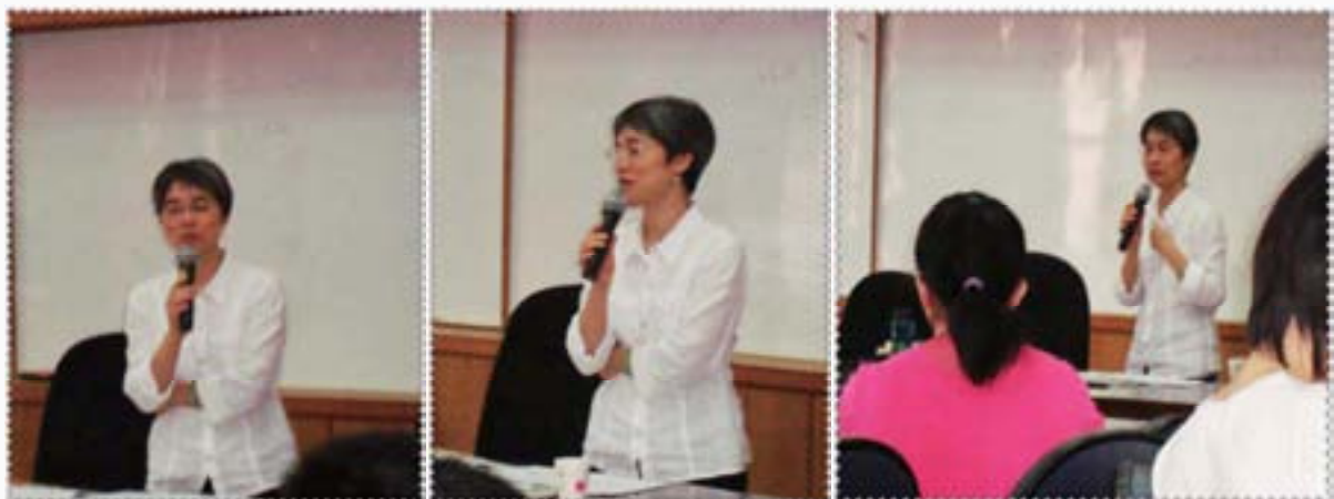
清晨與「智慧」對話，譜一首文學的催眠曲！