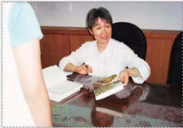
作家練達的筆跡鑲嵌在智慧的扉頁上，今天我得到最好的一份「見面禮」！