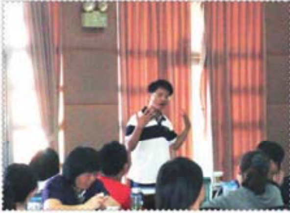
文質彬彬的穎川老師