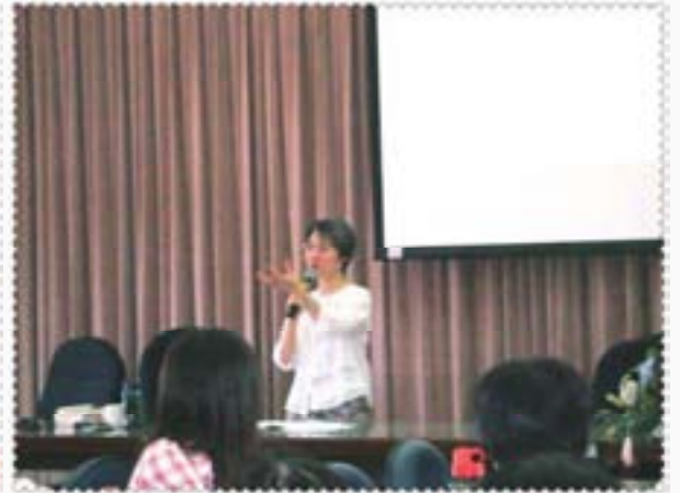
從各個不同角度捕捉作家獨特的神韻及丰采。