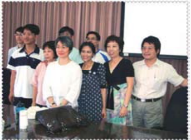
結束啦！把握時機和簡嬪老師來個團體照。