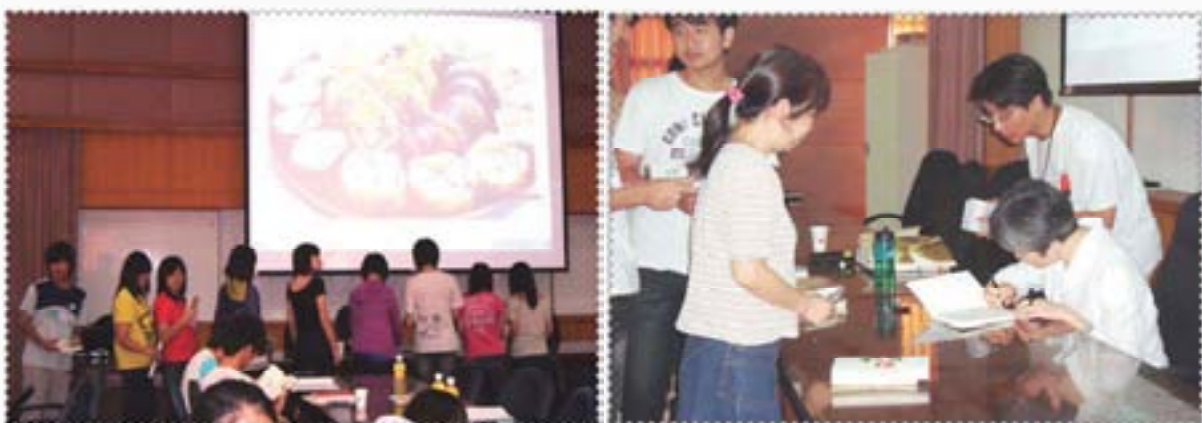
一字排開，等待作家為我簽書！