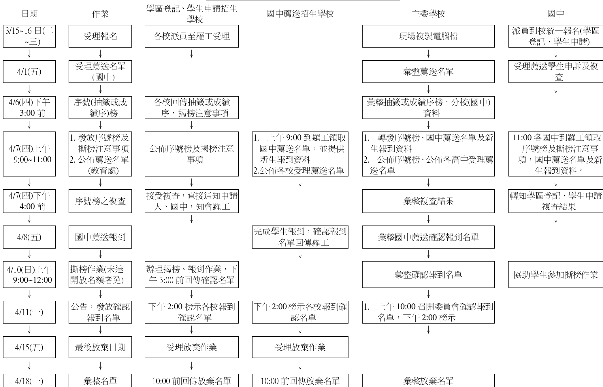
宜蘭區 100 學年免試入學招生學區各模式作業流程表