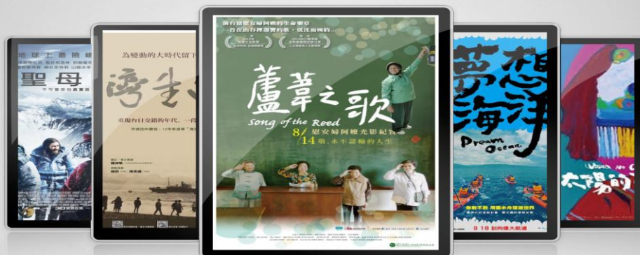
聖母峰 10/4 羅東統一戲院