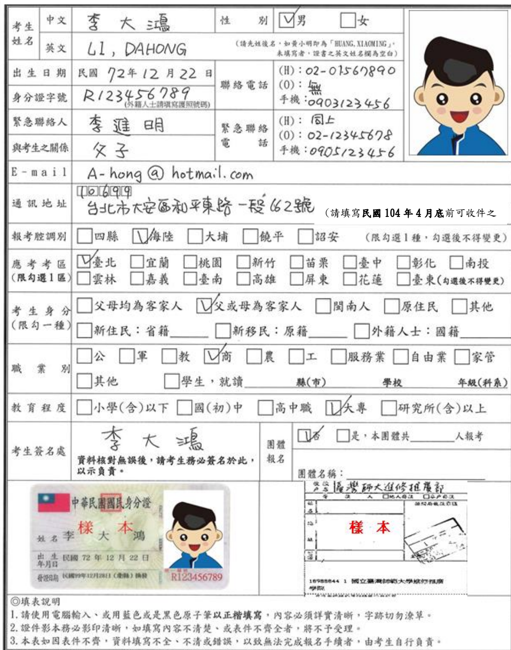
附件 1-1 103 年度客語能力認證中級暨中高級考試 報名表