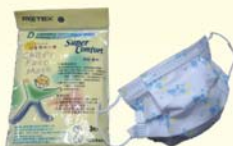
兒童花樣鑽石型口罩