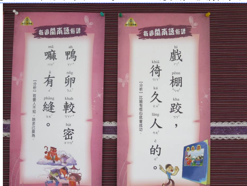
●說明：常聽的閩南語俗諺，融於品德教育—有恆教學中。