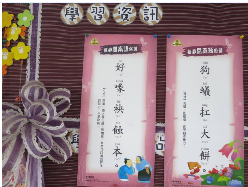
●說明：常聽的閩南語俗諺，融於品德教育--禮儀教學中。