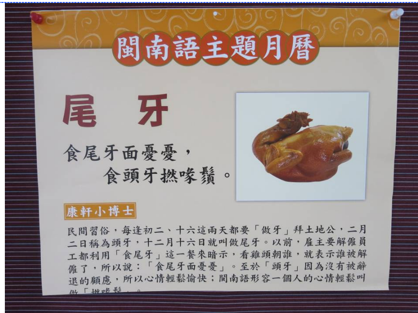
●說明：庶民節慶文化學習。