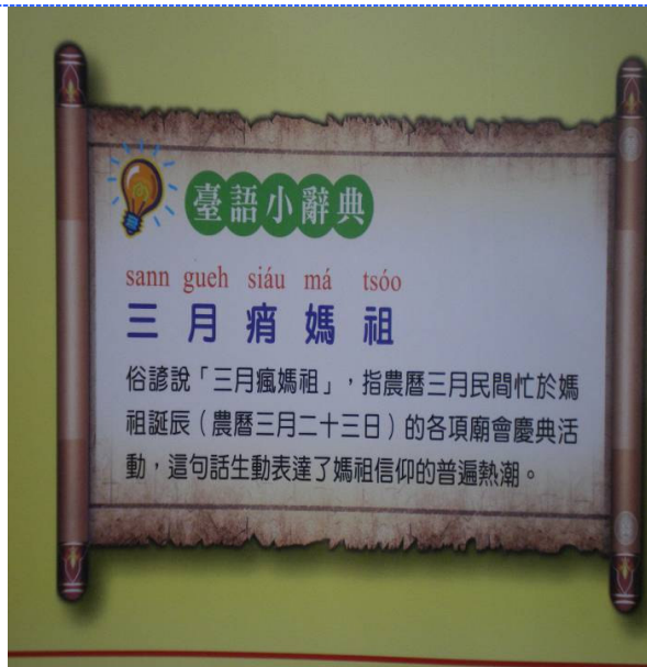
● 說明：農曆三月二十三日是媽祖的生日，人們為了感謝媽祖的守護，每年在祂生日前夕，會舉辦一場盛大的「媽祖繞境」活動。