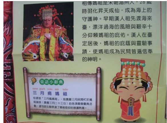
※配合民俗活動並說明活動的內容