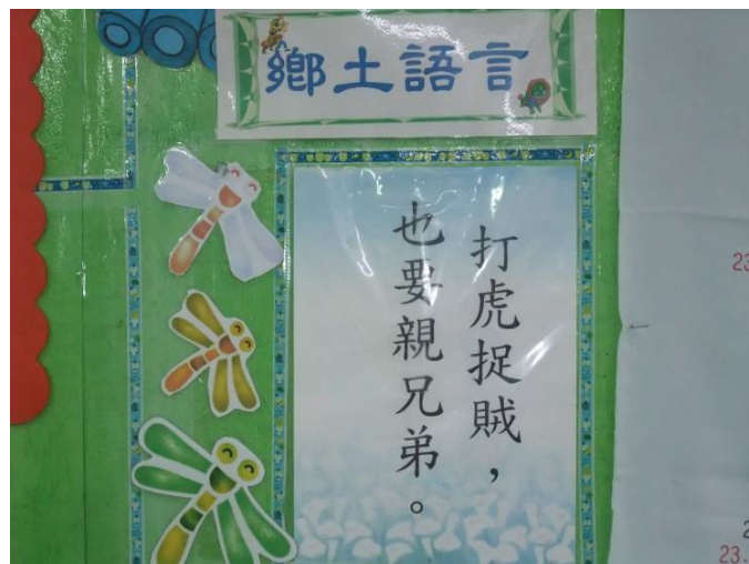
※台語俗諺張貼並隨時更換