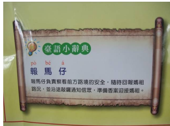
※配合民俗活動—臺語小辭典