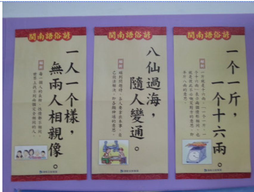
●說明：運用閩南語俗諺教材，補充學習內容。