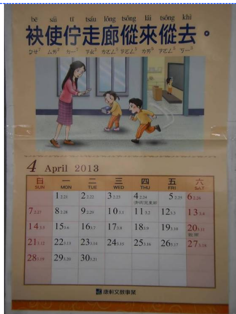
● 說明：台語主題月曆不只學台語，還能從中學到校園安全常識。