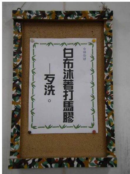
● 說明：趣味的台語歇後語看板。