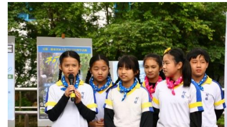
▲廣播社小解說員侃侃而談展現自信風采!