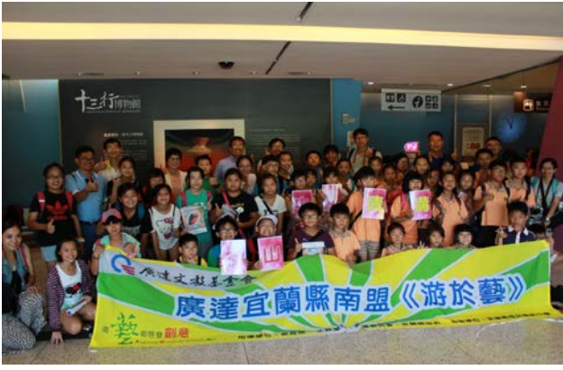
第一階段課程-第二組合照