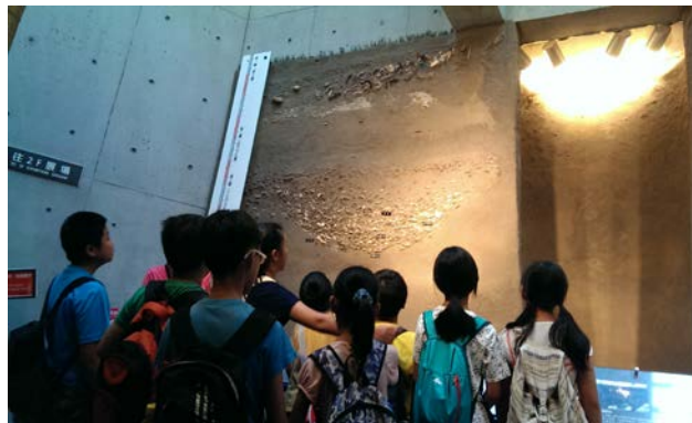
第一階段課程-博物館導覽學習