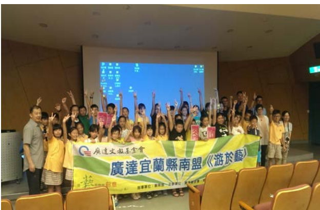
第二階段課程-第二組合照