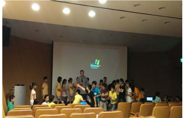
第二階段課程-肢體開發與自信培養