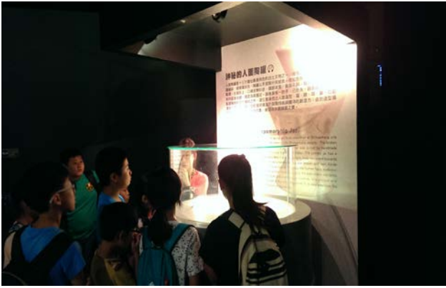
第一階段課程-認識十三行文化