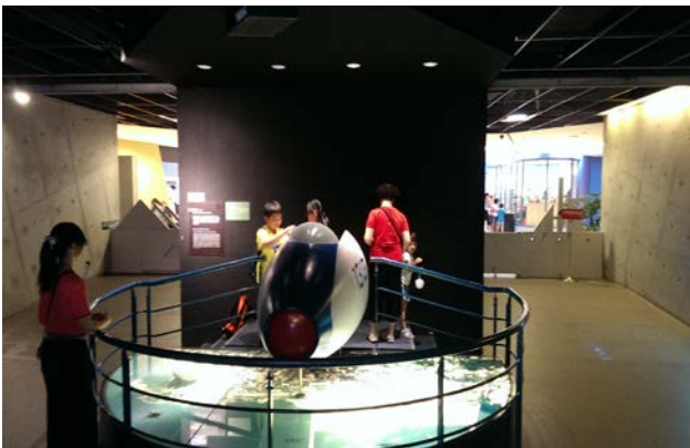
第一階段課程-分組討論如何進行導覽