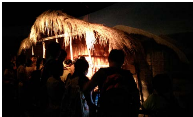
第一階段課程-了解史前人類一天生活