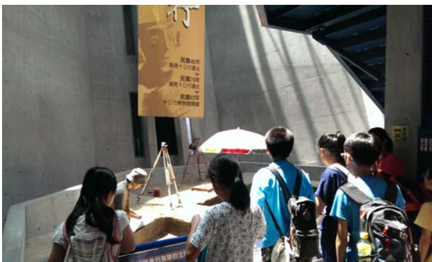
第一階段課程-認識十三行博物館