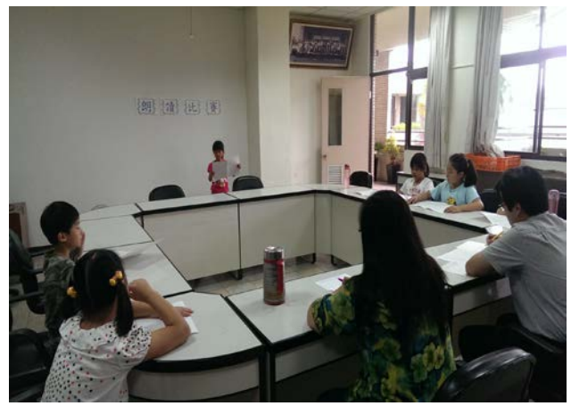
一~三年級朗讀比賽