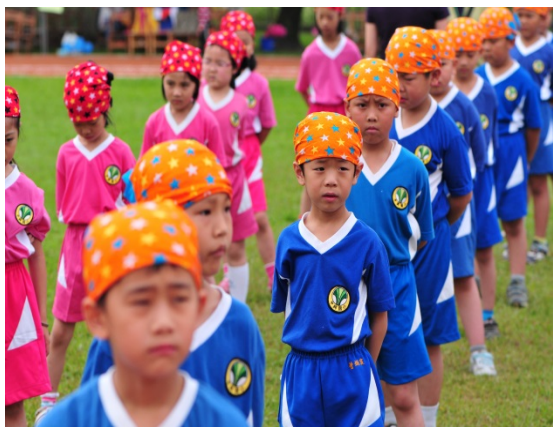
拍攝學校代表性照片-興服藍