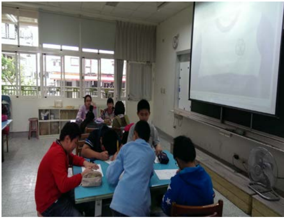
小感動猴草稿設計