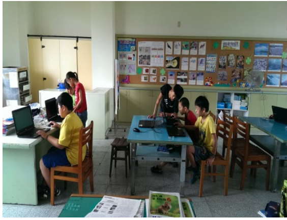
選出在地文化色彩