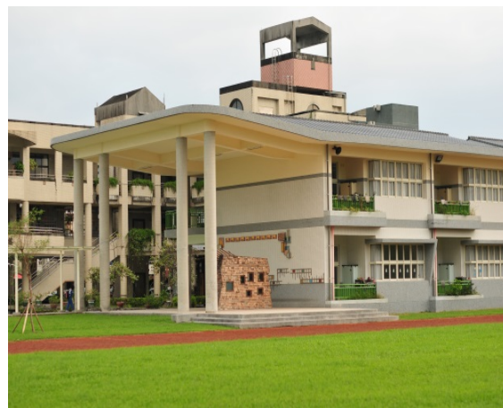
拍攝學校代表性照片-興草綠