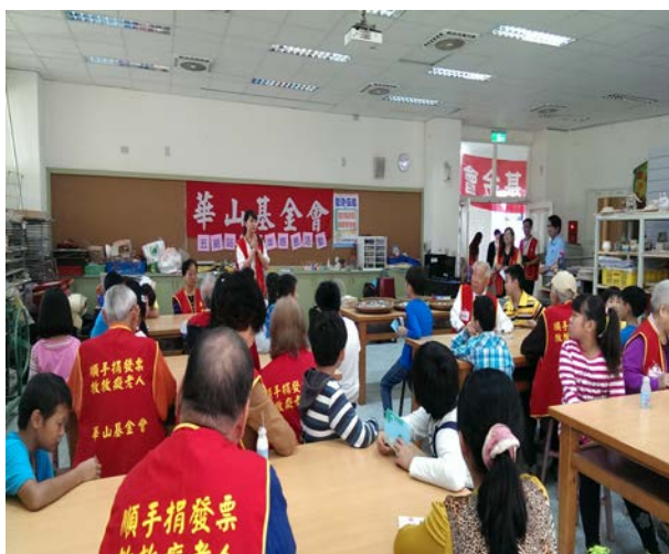
五結天使站工作人員說明活動流程