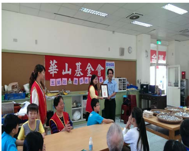
致贈本校熱心參與活動感謝狀