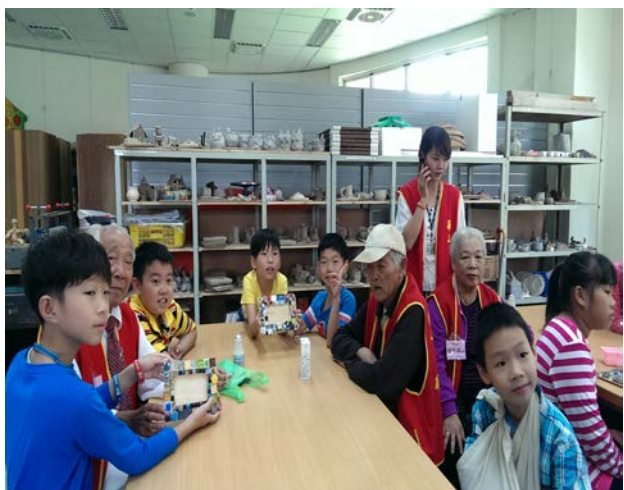
相框製作完成小組合照