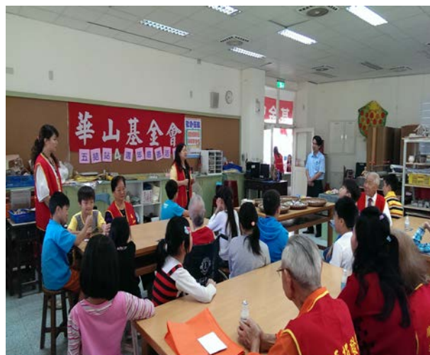
五結天使站站長致詞