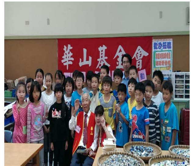
爺爺和四忠學生大合照