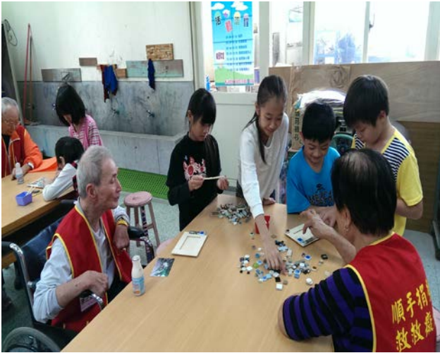
與長者一起拼貼相框