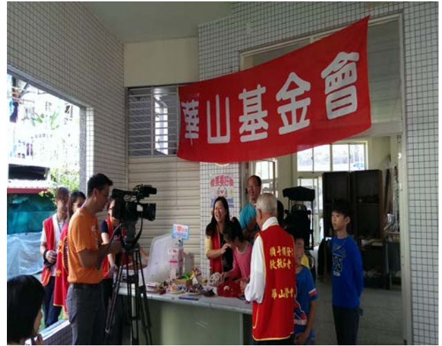
宜蘭新聞記者採訪