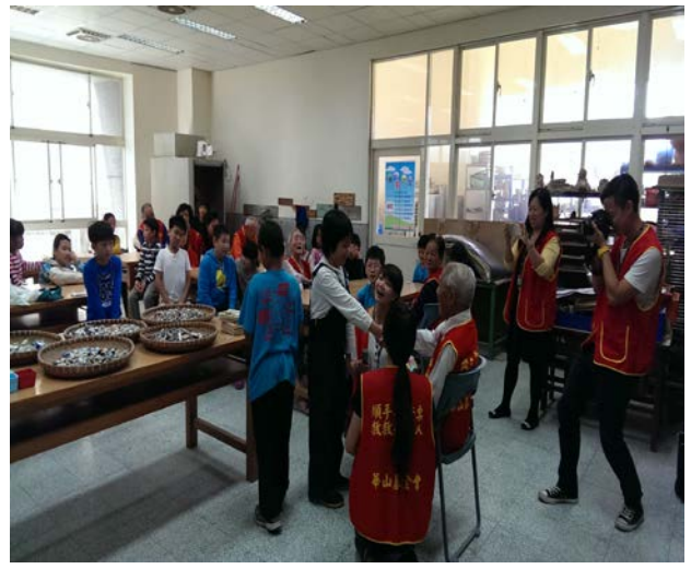
和爺爺握手並送上祝福