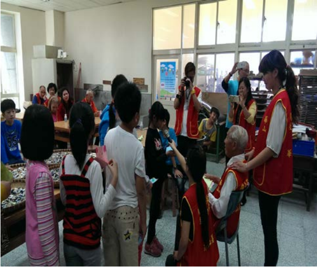
學生獻上祝福卡片並朗讀祝福內容