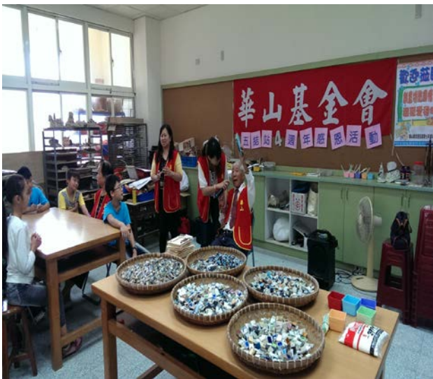
爺爺很開心能收到學生祝福的卡片