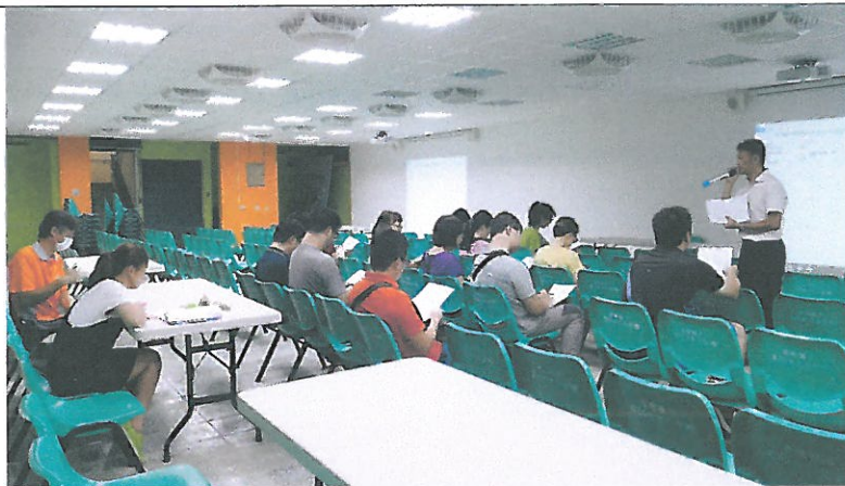
108.6.19 於本校視聽中心召開課發會