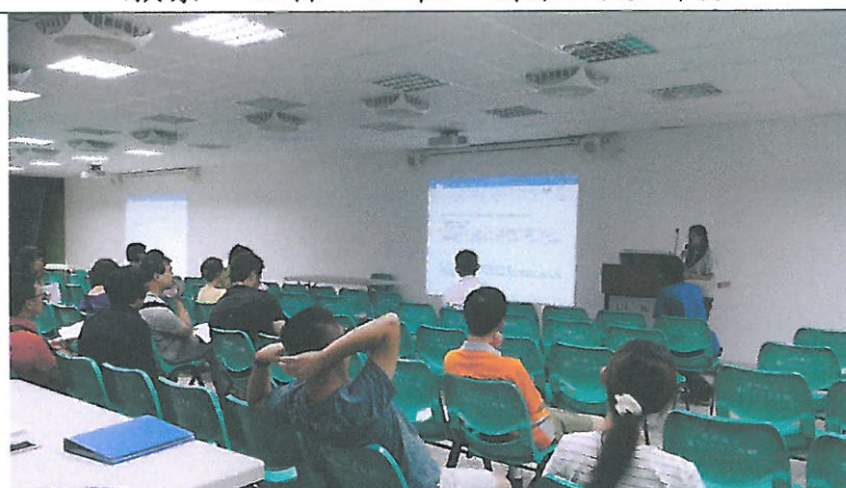
討論本校 108 學年度特殊教育開設課程 (含身心障礙及資賦優異類)及學習節數規劃