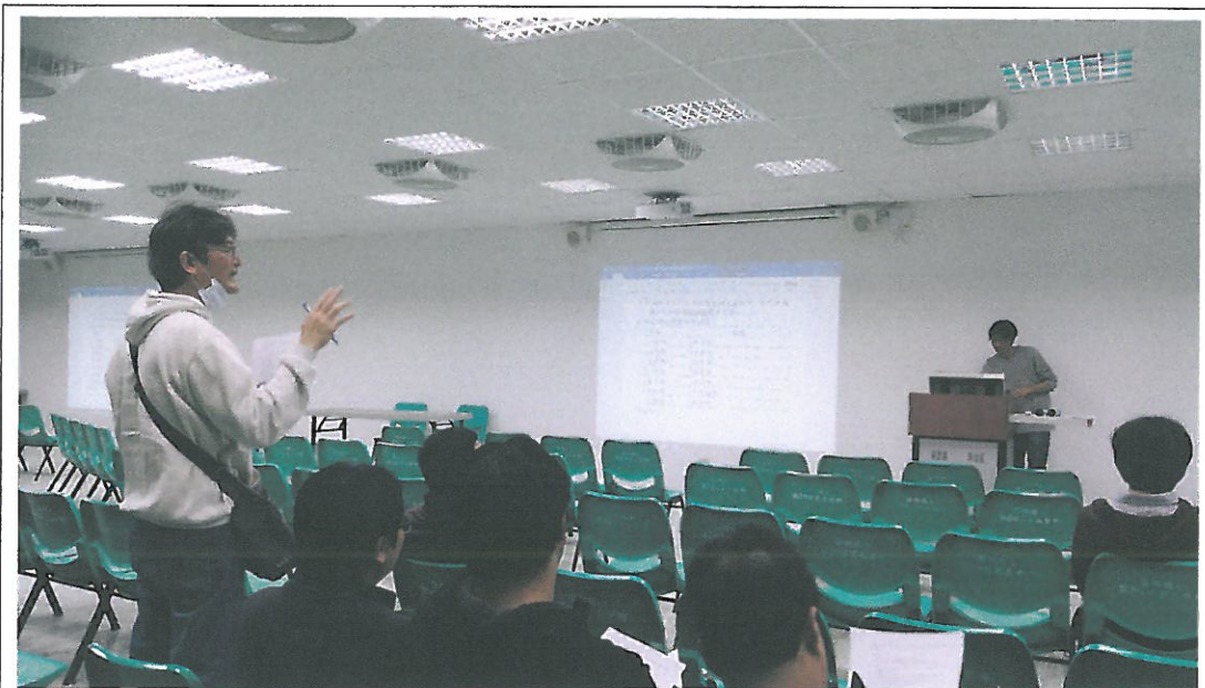
討論教師公開授課辦法