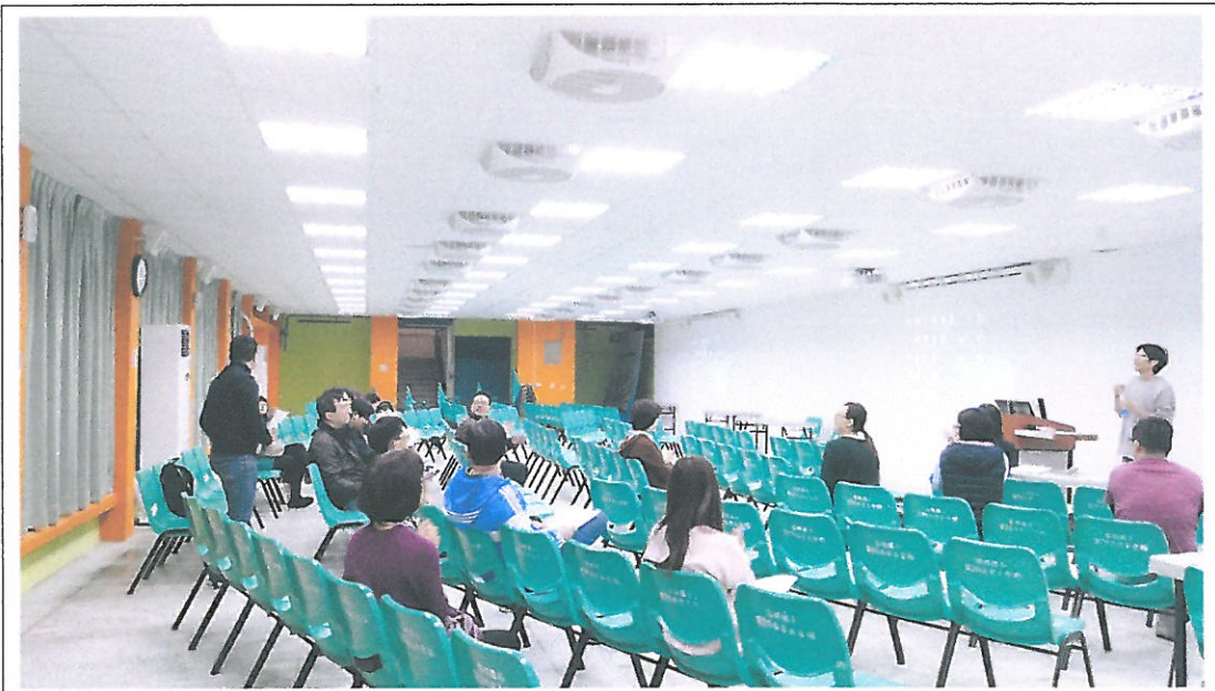
108.2.27 本校家長會長參加課發會