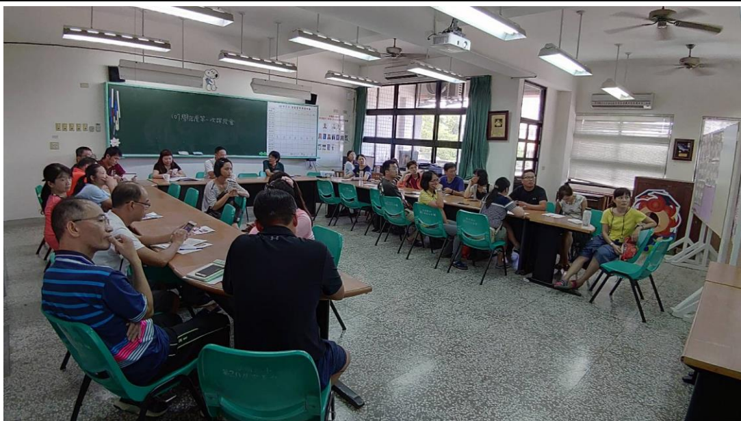
107 學年度第一次課發會會議於本校樹人樓二樓會議室召開