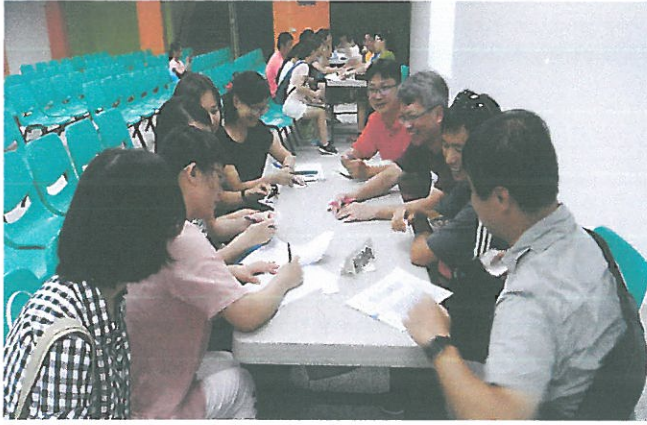
綜合領域小組專業對話