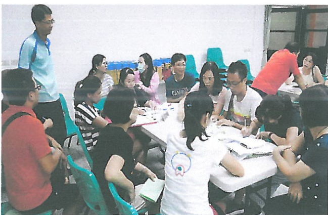
語文領域小組專業對話