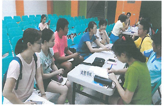
健體領域小組專業對話