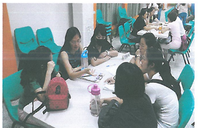
英語領域小組專業對話