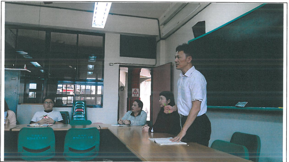
107.3.14 於本校家長會辦公室召開課發會