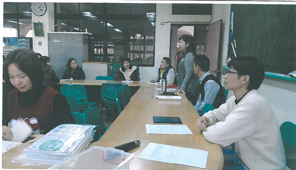
本校家長會會長參與課發會，提供建議事項