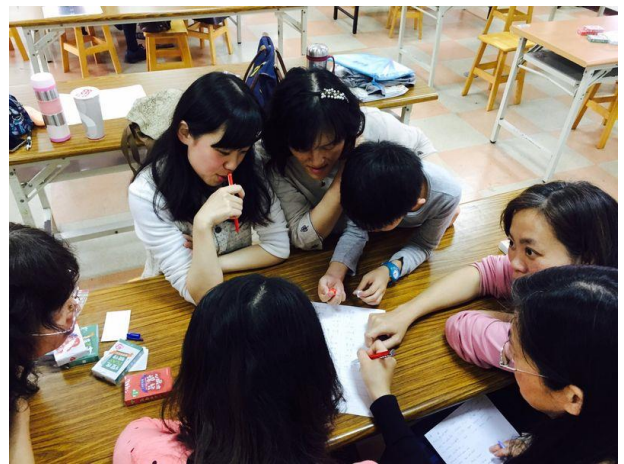
老師們實際操作，自己設計一組桌遊。