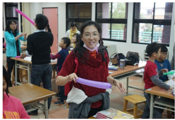
利用氣球玩科學-靜電， 靜電水母與驗電器製作