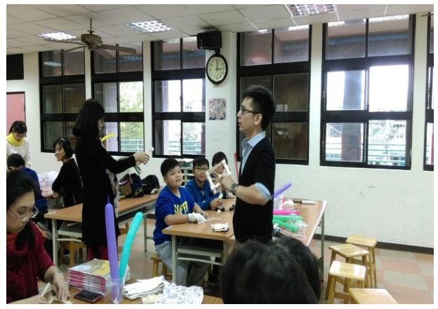
簡易投石機-運用槓桿與彈力