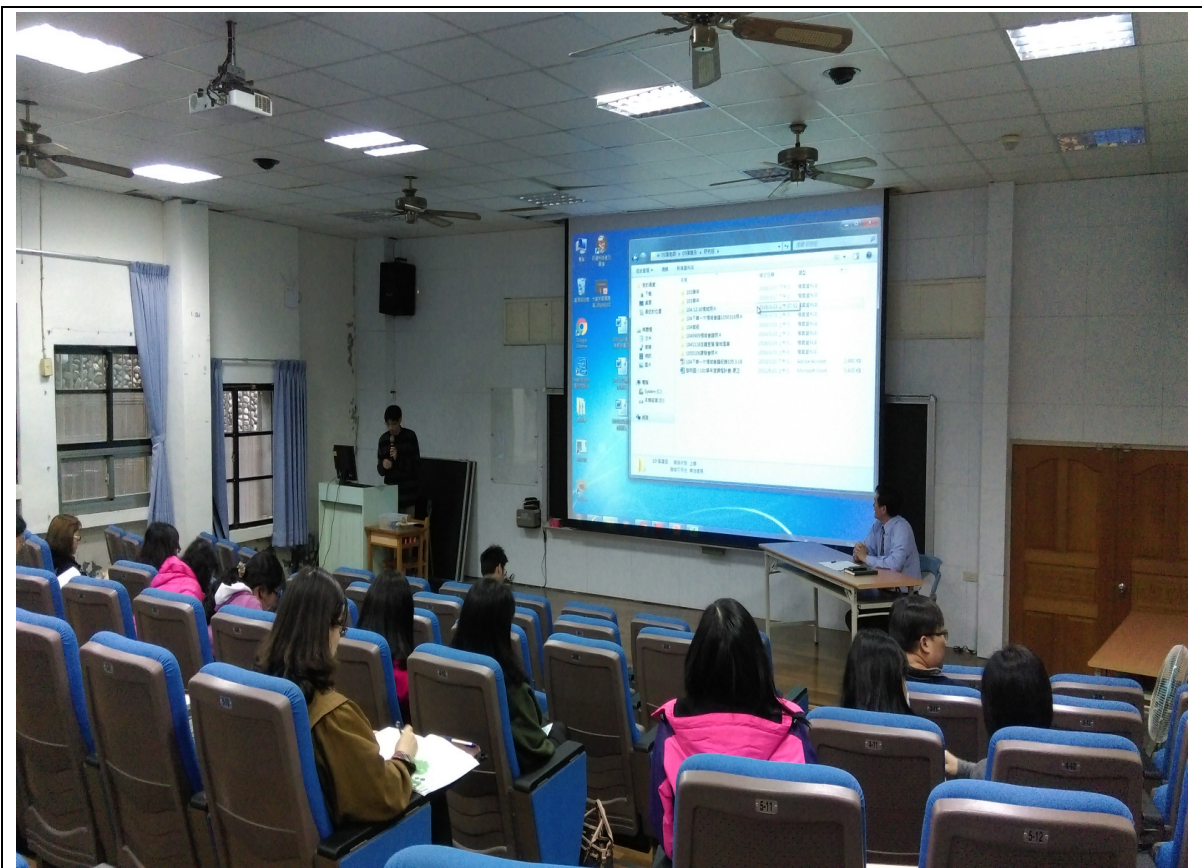
105. 3. 23 於本校視聽教室召開課發會