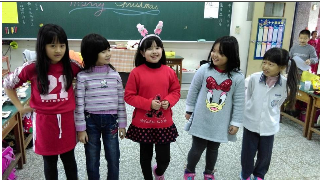
唱遊-叮叮噹！叮叮噹！鈴聲多響亮！