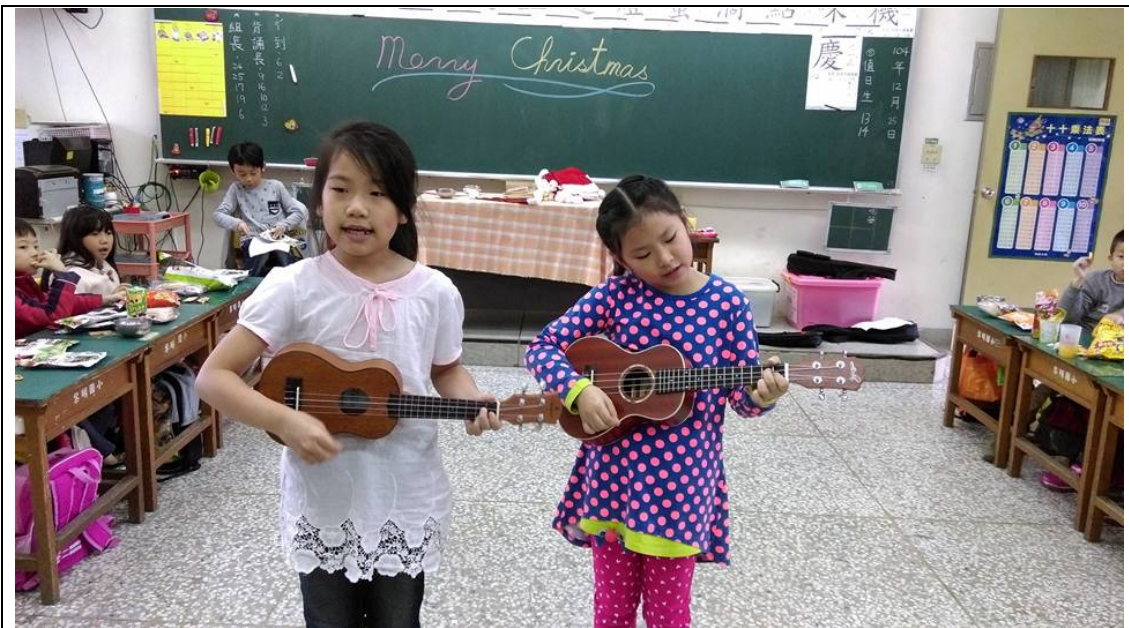
樂器演奏-烏克麗麗。