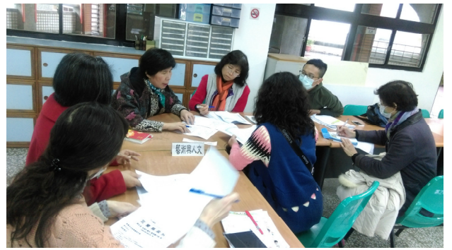
藝文領域小組專業對話