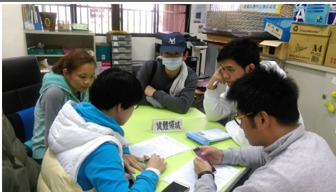
健體領域小組專業對話