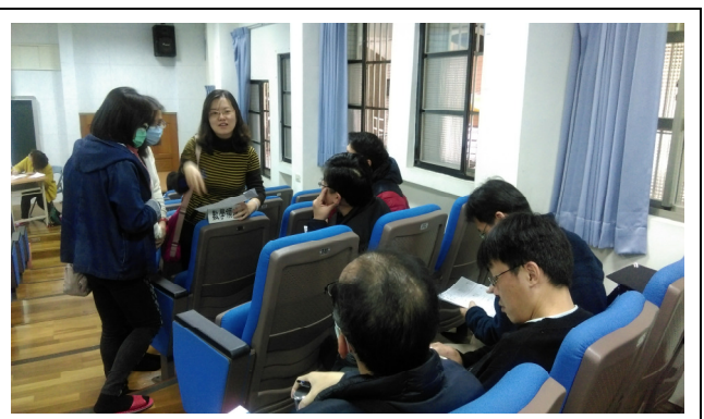
數學領域小組專業對話