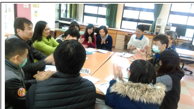
語文領域小組專業對話