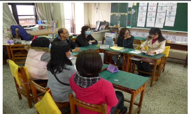
綜合領域小組專業對話