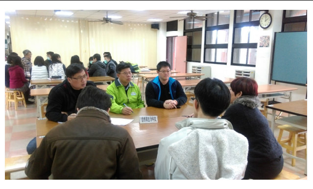
自然領域小組專業對話