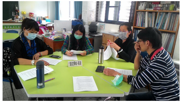
英語領域小組專業對話