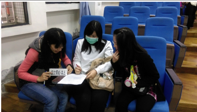
本土語領域小組專業對話