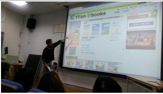
社會領域小組專業對話