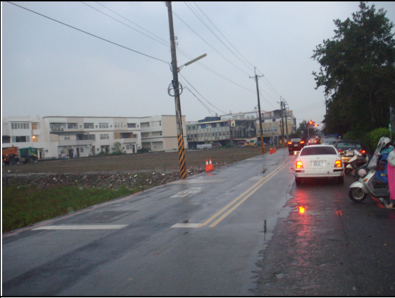
改善前照片-學生放學情形-商家興建中