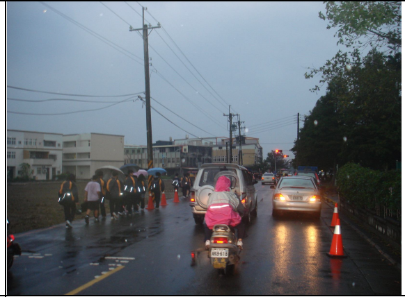
改善前照片-學生放學情形-用路狹窄