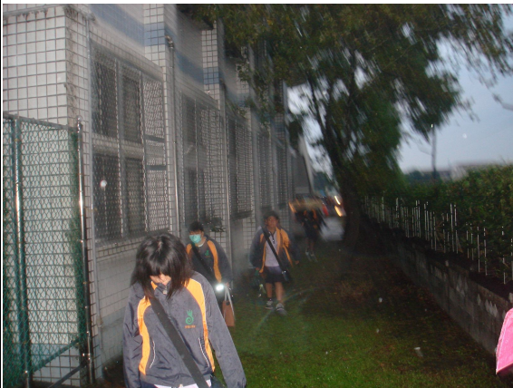
改善前照片-學生放學步道-雨遮侯車