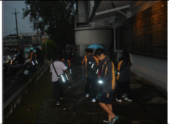
改善前照片-學生放學侯車情形