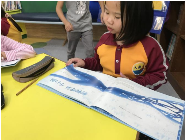
認真專注的閱讀二