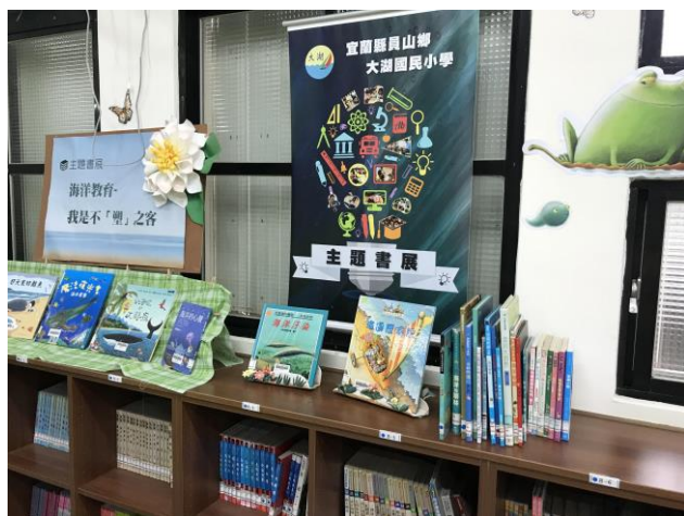
圖書館不「塑」之客主題書展