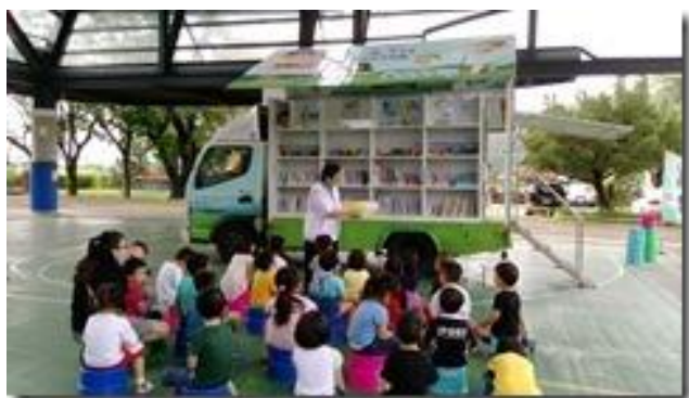
佛光山志工媽媽說書一