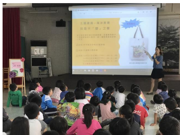
學生晨會說明不「塑」之客主題書展一