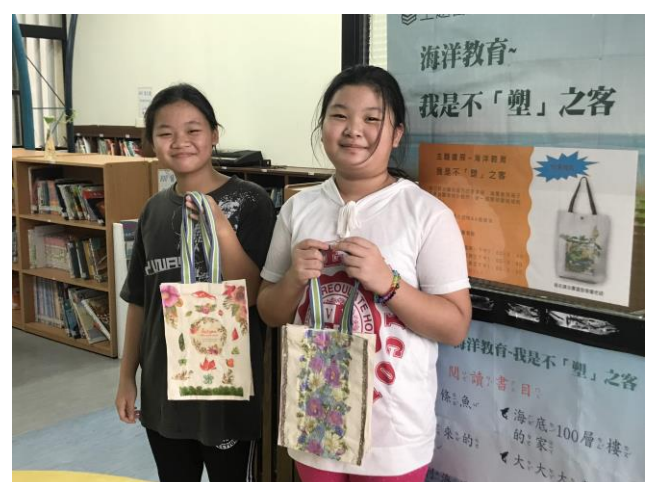
屬於自己獨一無二的提書袋完成了