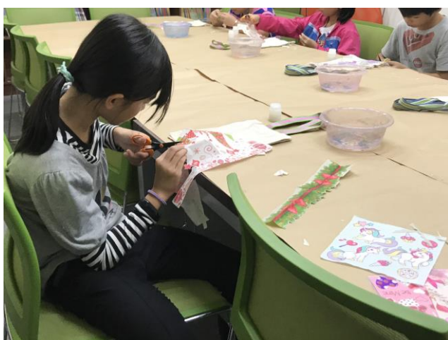
蝶古巴特提書袋製作二