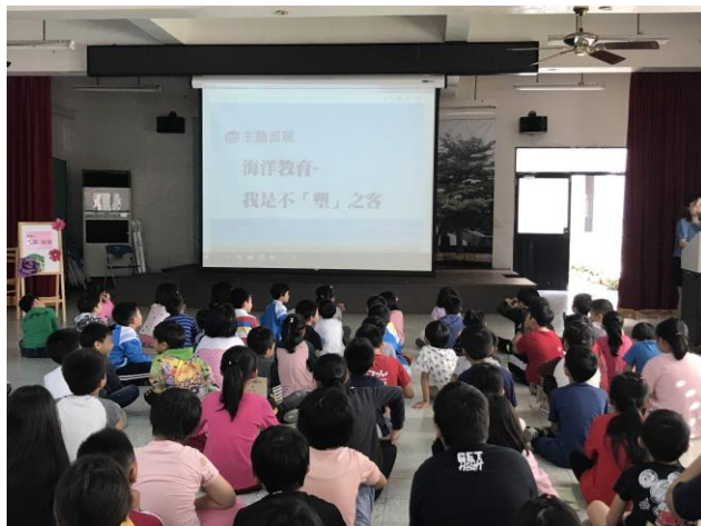
學生晨會說明不「塑」之客主題書展一