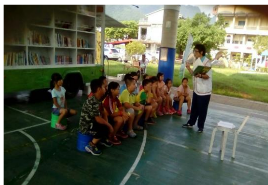
佛光山志工媽媽說書二