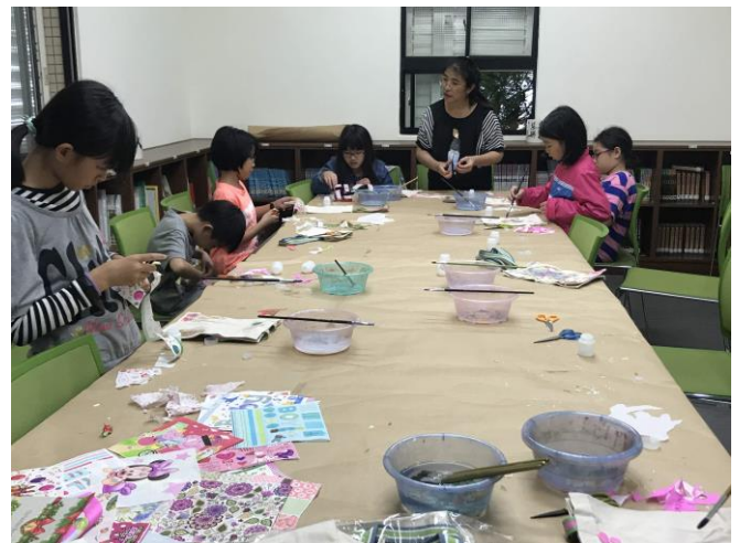
蝶古巴特提書袋製作一