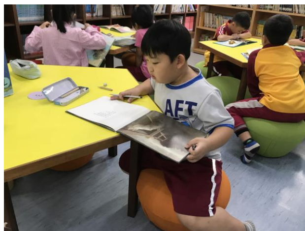
認真專注的閱讀一