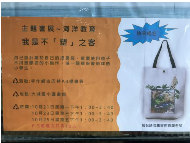
蝶古巴特提書袋製作