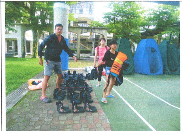
學生開始進行溯溪裝備著裝