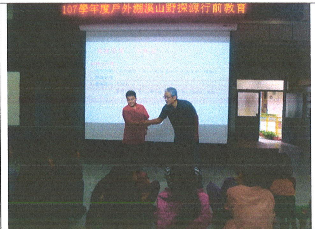
示範互助時切記握住手腕而非手掌