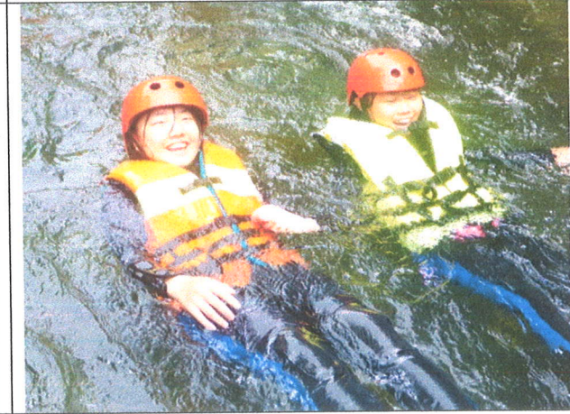
漂流在河面上好清涼！