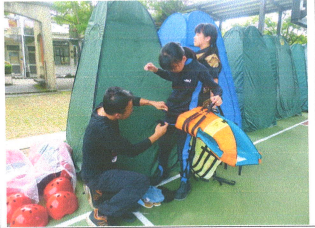
隨隊教練檢查學生著裝情形