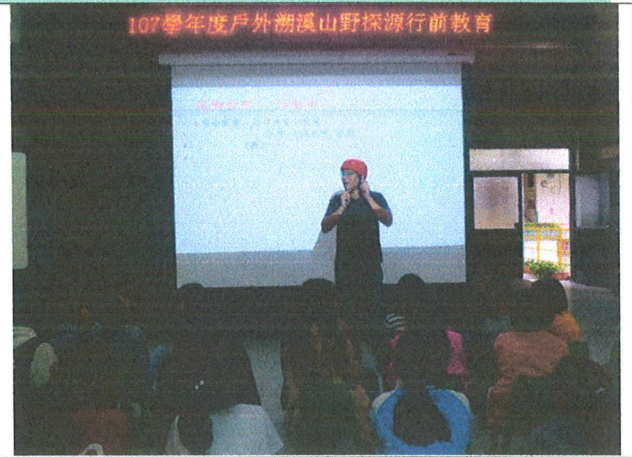
活動前的風險管理