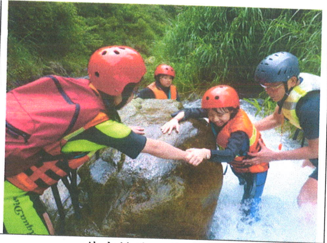
伸出援手，共同前進