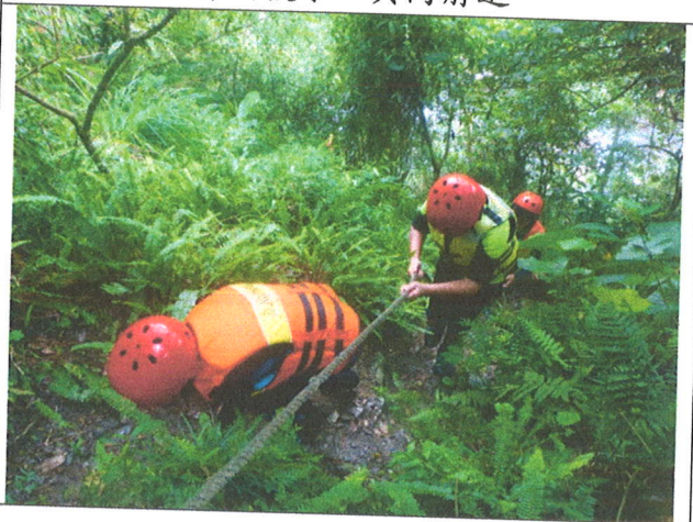
向上攀爬，手腳並用