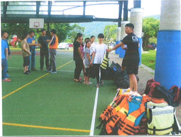
學生排隊領取裝備