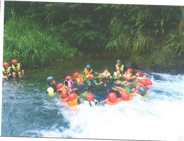
互相信任才是同心圓