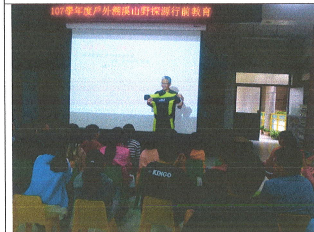
介紹裝備與如何正確穿戴(防寒衣、救生衣、頭盔以及溯溪鞋)